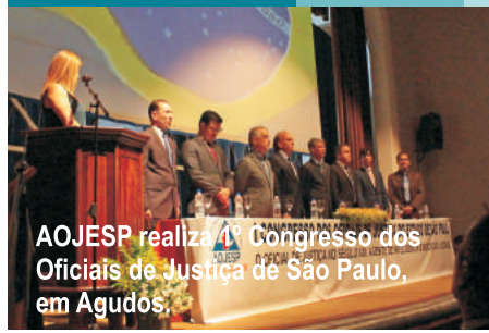
AOJESP realiza 1º Congresso dos Oficiais de Justiça de São Paulo, em Agudos.

A gestão Novos Rumos vem realizando reuniões nas comarcas com o intuito de ouvir reivindicações específicas dos Oficiais de Justiça de cada região, bem como levar ao conhecimento dos mesmos os principais pleitos da categoria. Veja aqui as reuniões realizadas nos anos de 2017 e 2018.