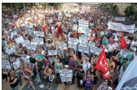
Os servidores da Educação e da Saúde tomaram conta da Praça da República.