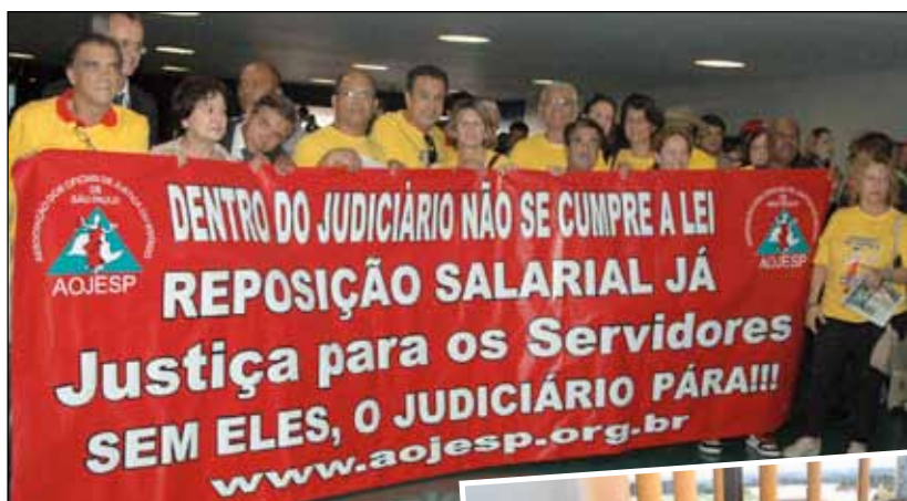
Oficiais de Justiça liderados pela AOJESP se manifestam nos corredores da Câmara Federal.