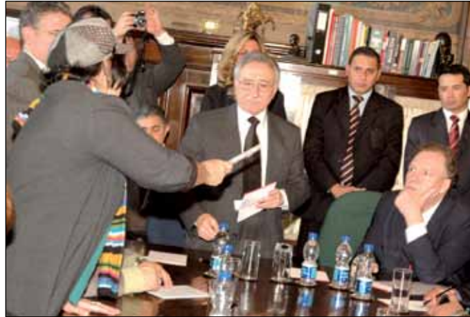
Yvone entregou ao Des. Bedran uma cópia da entrevista que a Ministra Corregedora do CNJ, Eliana Calmon, concedeu à TV Senado.

“No momento é o que podemos oferecer. Eu sei que há os 4,77% (devido do retroativo entre março e novembro de 2010). Nós vamos continuar no trabalho, na tentativa de mais recursos orçamentários, que todos sabem, provém do Executivo”, disse o