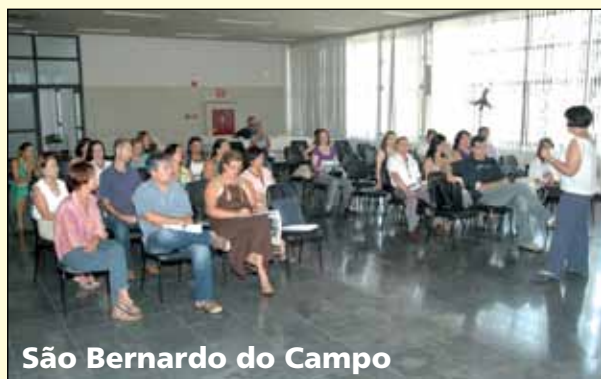
São Bernardo do Campo